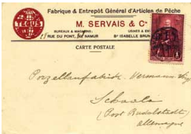
▲ Postkaart voor het buitenland, gefrankeerd aan 1Fr. internationale port, vanuit Namen 30.XI.1930 naar Duitsland (laatste dag van gebruik)