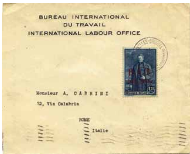
▲ Brief voor het buitenland, internationale port 1,75 Fr. tot 20 g van Brussel Raad van Bestuur B.I.T. 12.X.1930 naar Italië