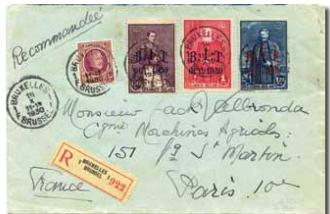
▲ Aangetekende brief voor het buitenland : gewone brief 1,75 Fr. , aangetekend 1,75 Fr. Enige mogelijkheid is de 3 B.I.T.-postzegels samen te voegen. Op aangetekende brief van Brussel 16.X.1930 naar Frankrijk via toevoeging van een postzegel van 15cets voor de exacte frankering : 1,75 Fr. internationale port + 1,75Fr. aangetekende brief, t.t.z. exact tarief 3,50 Fr.

Na talrijke jaren van onderzoekswerk, ziehier enkele voorbeelden van briefwisselingen die niet vals zijn. ✿