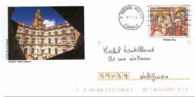
▲ Fig. 97 : Toulouse, reeks Haute-Garonne – 2005.