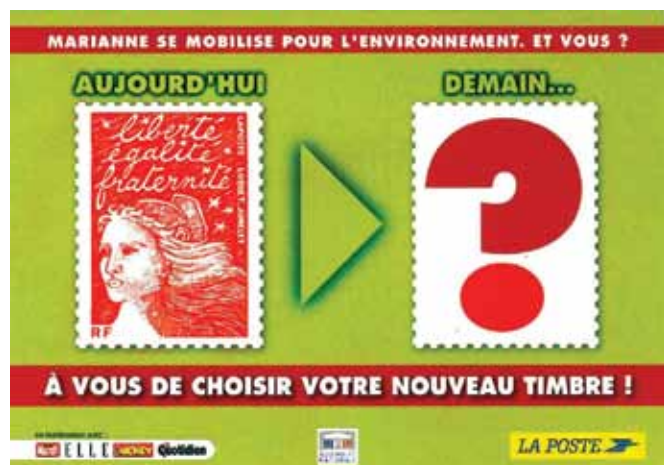
▲ Fig. 92b : Actie Franse Marianne - keerzijde

Ze moet niet reizen... behalve indien de bezoekers ze na hun terugkeer van het salon in een postbus gedeponereerd hadden. Wij hebben geen kennis van dergelijke documenten die gecirculeerd hebben naar het aangeduide adres. Wij denken echter dat dit zich heeft moeten voordoen en in dat geval beschouwen wij de kaart als bruikbaar in een thematische verzameling.