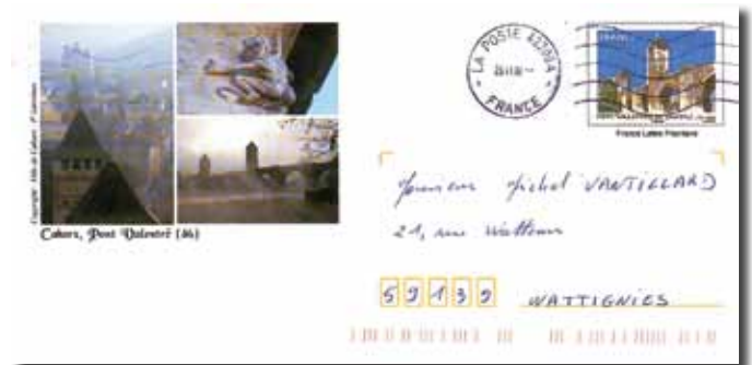
▲ Fig. 101 : Brug Valentré Cahors – 2010.

Wij danken bij voorbaat de lezers die ons hun mening en opmerkingen overmaken, evenals de ontdekking van een bijzondere, nog niet opgemerkte "Ready-to-Send".