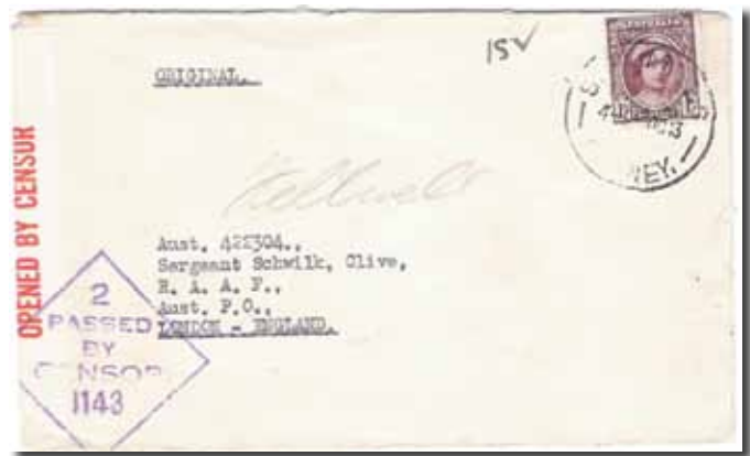
Afb. 5 Brief van Sydney, Australië 4-12-43 naar Sergeant Clive Schwilk die in juni 1944 door de lijn "Comète" werd opgevangen. Australische censuurstrook "Opened by Censor" en stempel in ruit "2 Passed by Censor 1143".

In totaal bracht de ontsnappingslijn "Comète" bijna 800 onderduikers, waarvan 707 geallieerde vliegeniers in veiligheid. Van de ongeveer 2000 helpers en medewerkers werden er ruim 800 aangehouden waarvan er 216 de oorlog niet overleefden.