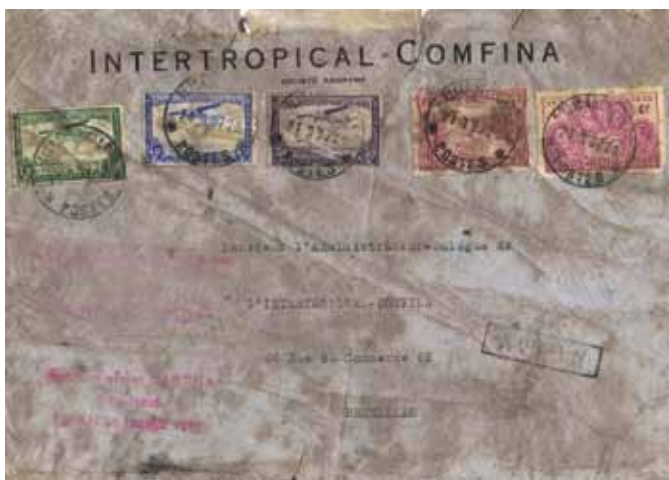
Fig. 5: Brief uit Betroka (Madagascar) van 11 januari en in Leopoldstad overgeladen op het Sabenatoestel OO-AGR. Handgeschreven notitie. Aankomst Parijs 29 januari. ▶