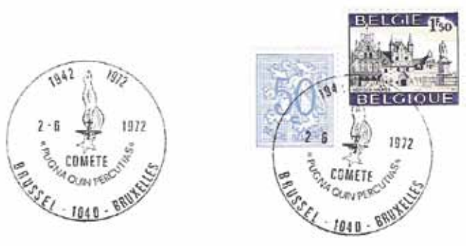
Afb. 1 stempel met embleem van "Comète" en motto: "Pugna Quin Percutias" (strijd zonder wapens)

De winter was een slechte periode voor de lijn, want niet alleen de route over de Pyreneeën was nagenoeg onbruikbaar wegens de sneeuwval maar ook de oversteek van de gezwollen rivier Bidassoa met zijn stroomversnellingen was erg gevaarlijk. Dit blijkt uit het volgende verhaal.