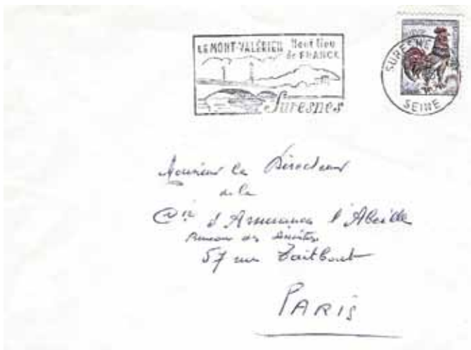
Afb. 2 Vlagstempel le Mont Valérien