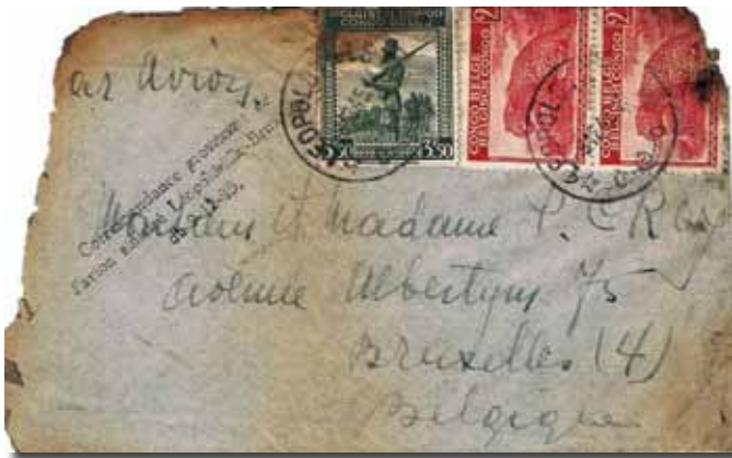
◀ Fig. 7: Brief uit Leopoldstad voorzien van de drieliijnige zwarte stempel Correspondance provenant de l'avion sinistré Léopoldville – Bruxelles du 9-12-45.