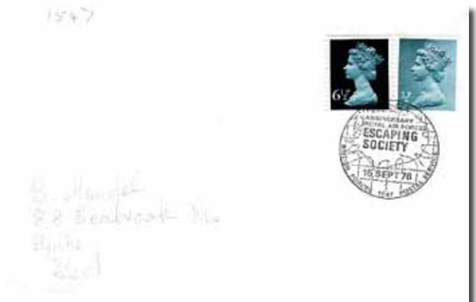
Afb. 6 Stempel RAF Escaping Society

In de basiliek van Koekelberg is een glasraam te bewonderen met onderaan rechts het embleem van "Comète". Het glasraam werd in 1953 door Prins Albert ingehuldigd. In de muur onder het glasraam werd in 1981 een herdenkingsplaat aangebracht, geschonken door de Royal Air Forces Escaping Society (Afb.6).