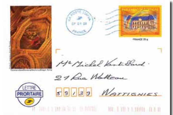
▲ Fig. 100 : Het Parlement van Bretagne – 2005.