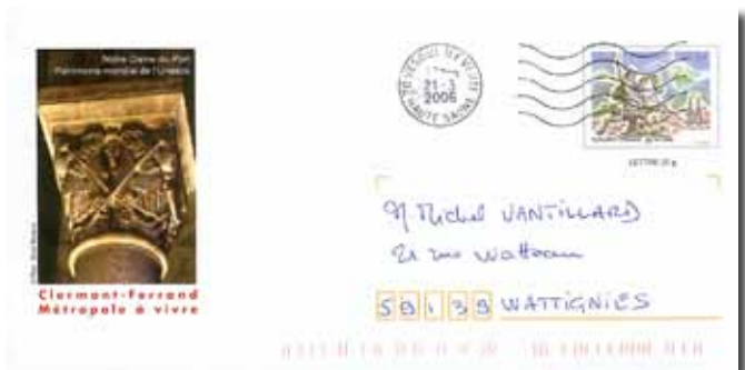
▲ Fig. 98 : Clermont-Ferrand, Vercingetorix - 2006.

een "niet bij elkaar passende" afstempeling (fig. 98 – afst. Vesoul).