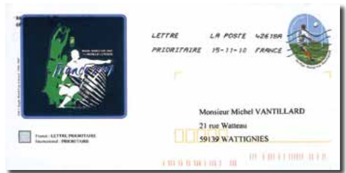
▲ Fig. 99 : Wereldbeker Rugby – 2010.