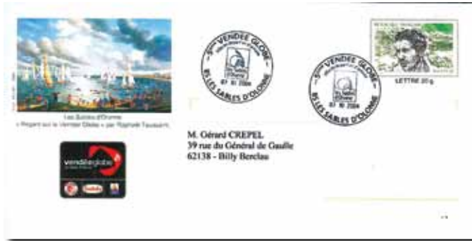
▲ Fig. 96 : Vendée Globe 2004.

In de mate van het mogelijke moet de keuze uitgaan naar een Ready-to-Send die gelopen heeft en een afstempeling bevat die "in harmonie" is met het onderwerp van de voorgedrukte postzegel en/of van de illustratie (fig. 96 en 97) en dus vermijden een document te presenteren met