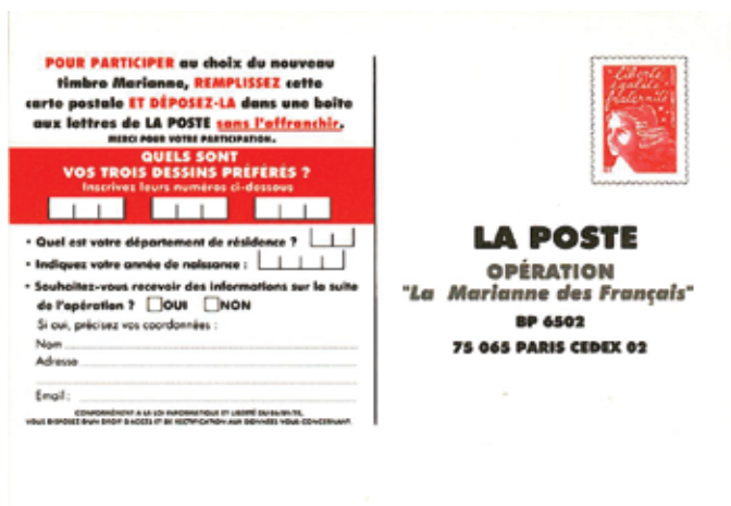
▲ Fig. 92a : Actie Franse Marianne – 2004.

Deze postkaart – beschikbaar voor het publiek - (fig. 92a & b), met voorgedrukte postzegel "Marianne de Luquet RF" en adres van de bestemming (De Post), moest volledig ingevuld "gepost" worden in een postbus ter plaatse op het Salon van de Postzegel, te Vincennes.