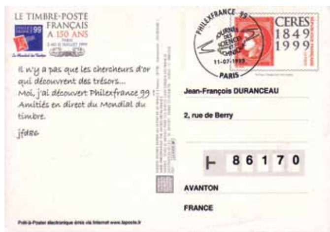
▲ Fig. 91. : e-Ready-to-Send PhilexFrance van 11.07.1999.

Nota : deze kaart was eveneens beschikbaar op de Internetsite van de Post, met een nummer onderaan links op de voorzijde (die van PhilexFrance heeft geen nummer).