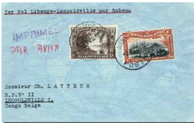
◀ Fig. 2: Brief uit Libenge gepost om met de eerste vlucht naar Leopoldstad mee te reizen. Frankering: 0.10 Fr gewoon port voor drukwerk 0.50 Fr luchtrecht per 20 gr voor binnenland totaal 0.60 Fr Aankomststempel Leopoldstad 6 september om 19 uur.