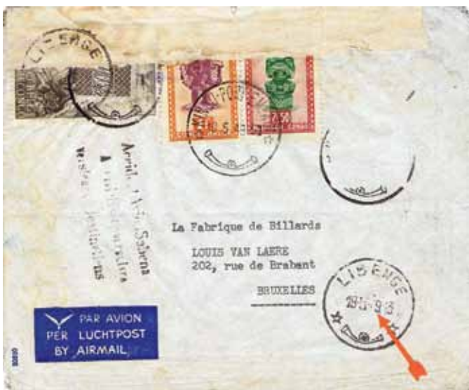
◀ Fig. 8: Een deel van de briefwisseling kon worden geborgen en werd naar Libenge overgebracht. Daar werd een stempel op drie lijnen aangebracht.

Let op de stempel van Libenge, waarbij per vergissing 19.05.1949 werd geplaatst.