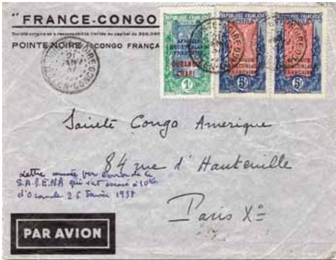
◀ Fig. 6: Brief uit Pointe Noire (Frans-Kongo) van 21 januari en via Leopoldstad verstuurd. Opnieuw handgeschreven informatie omtrent het ongeval. Aankomst 30 januari.