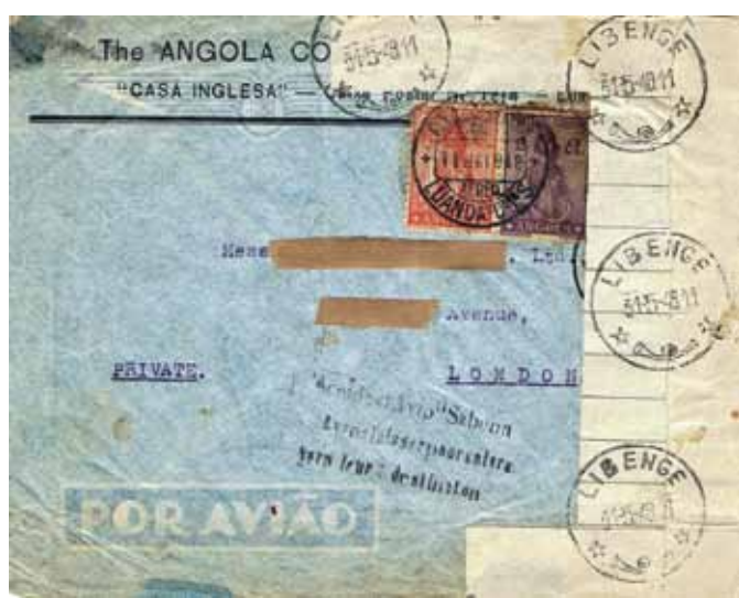
Fig. 9: Brief uit Angola met bestemming London, die te Leopoldstad aan boord werd geladen. ►

Bemerk de hoger geplaatste “n” op de eerste lijn en de uitdrukking in het enkelvoud voor de derde lijn. De aangebrachte datumstempel van Libenge 31 mei 1948 laat vermoeden dat het om een nalevering van geborgen poststukken betreft en dat men het primitieve stempeltje deels heeft hergebruikt/aangepast.