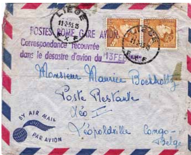
Fig. 11: Brief uit Luik met aankomststempel Leopoldstad 15.03.1955. Frankering: 3.00 Fr/20 gr gewoon port sedert 15.12.1948 3.00 Fr/10 gr luchtrecht sedert 01.07.1953 totaal 6.00 Fr

De omslagen kregen te Rome een bijzondere stempel op drie lijnen en werden dan verder doorgestuurd naar hun bestemming.