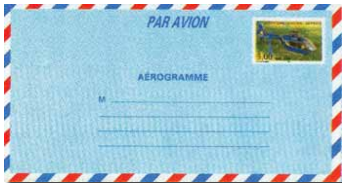
Fig. 93 : Aërogram Eurocopter. ▶

Er werden enkele documenten uitgebracht met de voorgedrukte postzegel "Helikopter EC 135" (fig. 93)