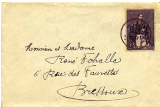
▲ Brief aan binnenlandse frankering 60c van THUIN 6.11.1930 naar Bressoux.

Op 6 oktober 1930 verschijnt een nieuwe reeks postzegels ter gelegenheid van de 50ste zitting te Brussel van de Raad van Bestuur van het Internationaal Arbeidsbureau.