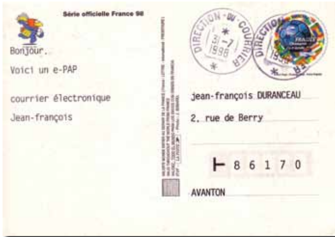
▲ Fig. 88 : e-PAP Franse voetbalploeg Wereldkampioen 1998.