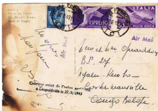
Fig. 10: Briefkaart uit Rome (Italië) naar Costermanstad, te Leopoldstad overgeladen op het vliegtuig naar Elisabethstad en waarbij de tweelijnige stempel werd geslagen. ►

Om een onbekende reden moest het toestel onmiddellijk na het opstijgen een noodlanding uitvoeren. Het vliegtuig vatte vuur waarbij drie bemanningsleden en twee passagiers omkwamen. De gerecupereerde briefwisseling kreeg een speciale stempel.