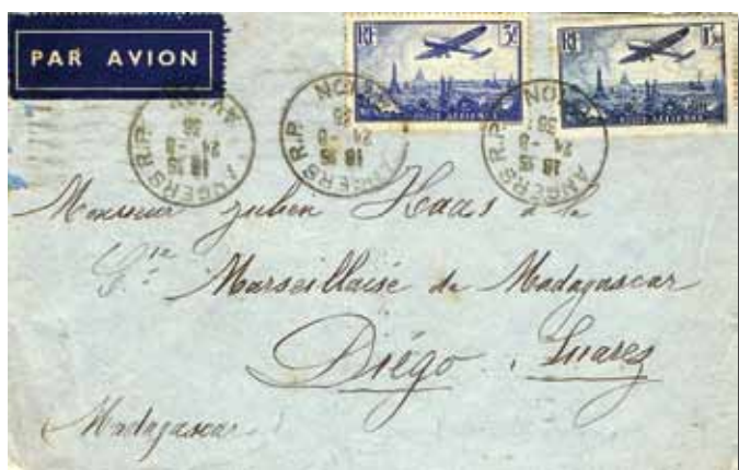
◀ Fig. 1: Brief uit Frankrijk in Marseille aan boord genomen met bestemming Madagascar. (aankomst 10 september via Leopoldstad – Elisabethstad – Tananarive)

Het toestel vertrok te Brussel op 29 augustus en maakte te Marseille dezelfde dag nog een tussenlanding om 's avonds in Oran te landen. Via Reggan (31.08), Niamey (01.09) en Fort Lamy (02.09) werd naar Libenge gevlogen, om er het nieuwe vliegveld in te huldigen. Door de slechte weersomstandigheden raakte het toestel echter vast in de modder. Met behulp van inboorlingen slaagde men erin het vliegtuig weer startklaar te maken.